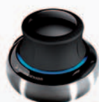
Personal Edition (PE) Standard Edition (SE)