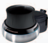
Włącznie z eleganckim etui na czas podróży